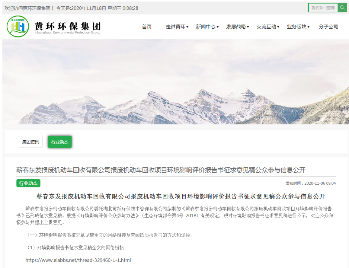
图 3-1 项目征求意见稿公示信息网上公示截图

蕪春东发报废机动车回收有限公司于 2020 年 11 月 6 日~2020 年 11 月 18 日在湖北黄环环保科技有限公司网站( http://hhhb2019.35xg.com/index.php/index/ashow_115.html ) 上将征求意见稿公开信息进行了公示, 符合《环境影响评价公众参与办法》在项目所在地相关政府网站公示的规定, 公示截图见图 3-1。