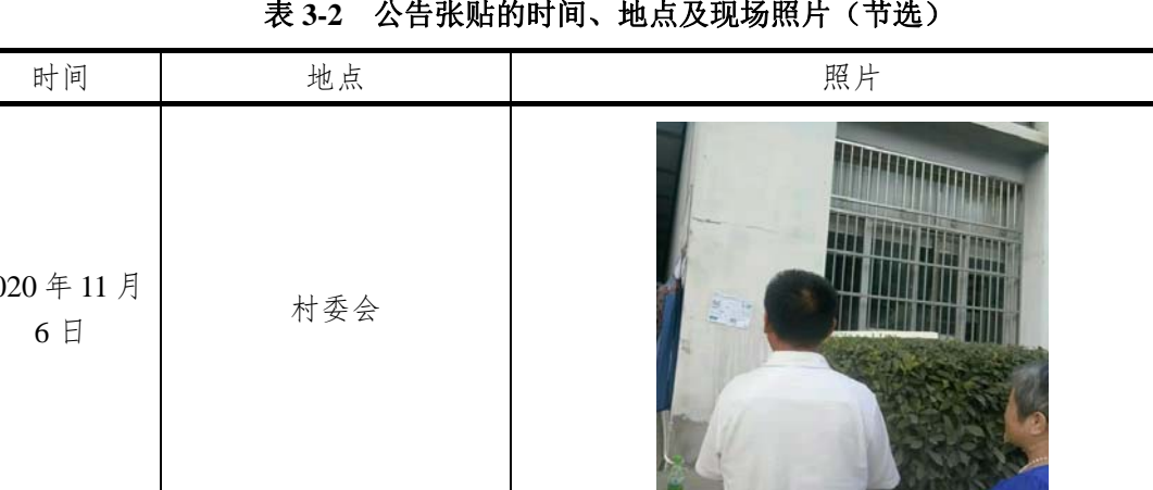
表 3-2 公告張貼的時間、地點及現場照片 (節選)

蕪春東發報廢機動車回收有限公司於 2020 年 11 月 6 日至 2020 年 11 月 18 日在村委會等設置的專用公告欄上將徵求意見稿公開信息進行了張貼公示。符合《環境影響評價公眾參與辦法》第十一條第(三)款“通過在建設項目所在地公眾易于知悉的場所張貼公告的方式公開,且持續公開期限不得少於 10 個工作日”的要求。公告張貼的時間、地點及現場照片見表 3-2。